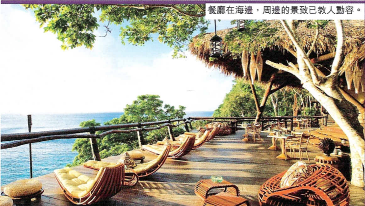
餐廳在海邊，周邊的景致已教人動容。

小島還設有婚禮教堂，可以包起整個島舉行一個 2 人至 80 人的婚禮，有專人擔任 wedding planner 安排一切，甚至更可以取得當地認可的正式結婚證書。穿上傳統斐濟服飾舉行婚禮，邀請親友在這裡參加派對兼一同度假，一齊度過難忘的假期。