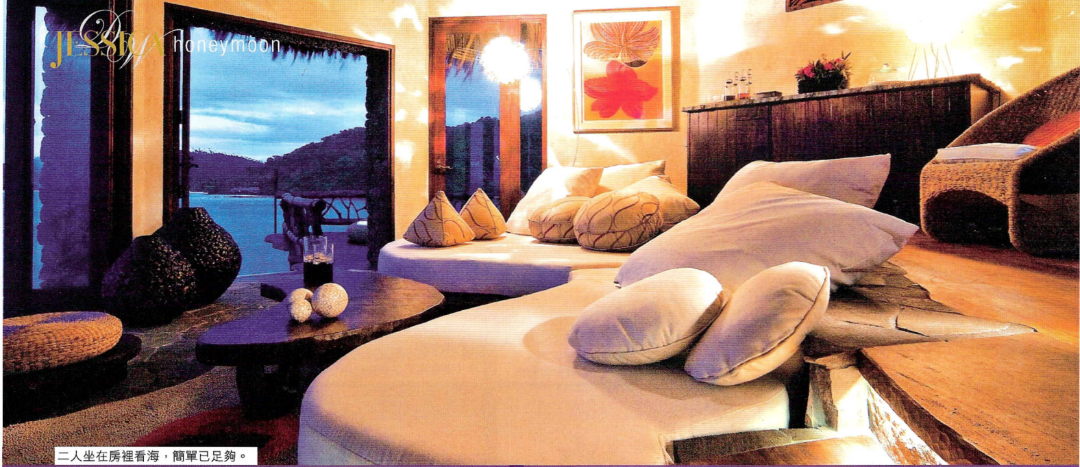
二人坐在房裡看海，簡單已足夠。